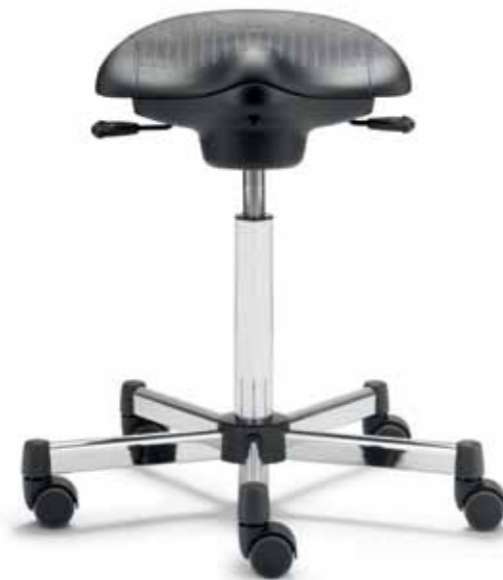
Ergo-Hocker, Voll-PU/ Ergo stool, full PU

Multifunktions- armlehnen PU/ Multifunctional armrests (PU)