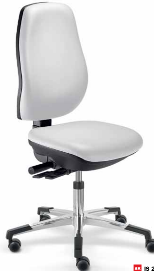
Arbeitsstuhl, Kunstleder/ Work chair, imitation leather

ST Synchrontechnik mit 4° Sitzneigung Synchronised feature with seat tilt (4°)