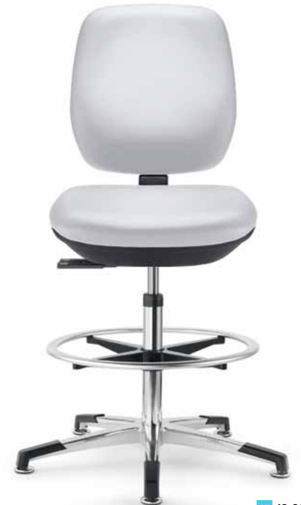
Arbeitsstuhl, Kunstleder/ Work chair, imitation leather

ST Synchrontechnik mit 4° Sitzneigung Synchronised feature with seat tilt (4°)