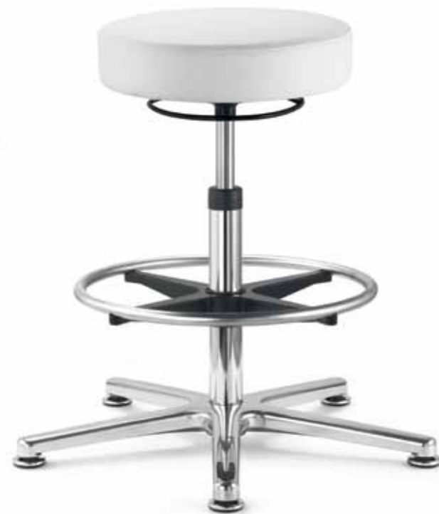
Hocker, Kunstleder/ Stool, imitation-leather

Multifunktions- armlehnen PU/ Multifunctional armrests (PU)