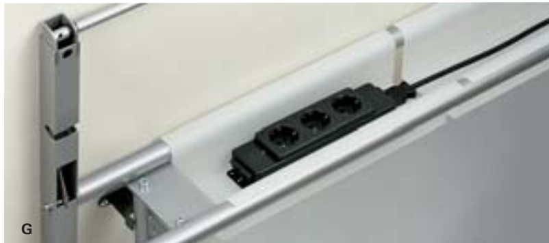
A Universell einsetzbarer, klemmbarer Utensilien-Becher. B Mobile wall mit magnetischer und beschriftbarer Oberfläche C Mobile wall als Pinwand. D Fußauslöser der Gasfederverstellung am Mobile-desk. E Mobile-desk mit Vollkernplatte, verchromtem Gestell und transluzenter Blende der Gasfedersäule. F Transportbügel G Transluzente Acrylglas-Kabelwanne für den System-desk.